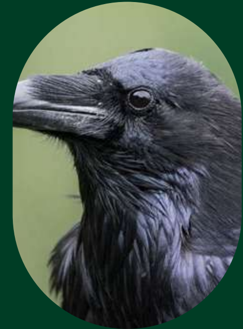
Pies et corvidés